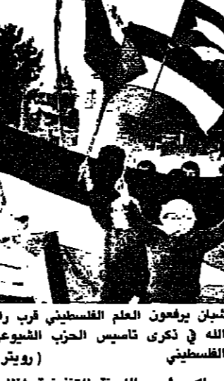
شبان يرفعون العلم الفلسطيني قرب رام الله في ذكرى تاسيس الحزب الشيوعي الفلسطيني

قال مصدر عراقي أمس أن وزير الخارجية العراقي طارق عزيز ونظيره الإيراني علي أكبر ولأيني سيجريان محادثات مباشرة في مقر الأمم المتحدة اليوم. وكان المصدر العراقي يتحدث بعد أن تلقى السيد عزيز مع الأمين العام للأمم المتحدة هانز بيير دي كويرل سيل تحويل الهدية السارية. منذ خمسة أشهر في الحرب الإيرانية العراقية إلى تصوية دائمة. وقال السيد عزيز للصحافيين دون أن يذكر تفاصيل أننا نتوقع معارفة من جانب الأمين العام غداً. أنه سيجتمع مع زميلي الإيراني وقد بلغته أنني ستكون رهن إشارته إذا أراد أن يراسي أو إذا أراد أن يرتب الاجتماع. وأضاف السيد عزيز قوله، إذا دعانا الأمين العام لاجتماع فإني ستكون على استعداد لاجتماع مع زميلي الإيراني. ولكنه قال أنه لا يعززم البقاء طويلاً في نيويورك. قال السيد عزيز، الذي اجتمع أيضاً مع السيد غاي براتاي وأنا سفير نييبل لدى الأمم المتحدة. الذي يرأس مجلس الأمن الدولي حالياً أن اجتماعاته السابقة مع السيد ولأيني كانت عقيدة إلى حد كبير. لا يمكنني أن أصفها بأنها كانت محادثات مباشرة حقيقية. وأضاف قوله، أن الجانب الآخر اختار أن يناقش في تلك الاجتماعات بدلاً